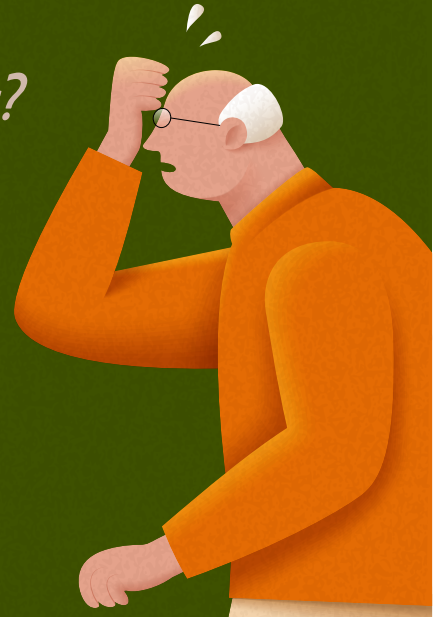
출처: 통계청, 2019 고령자 통계

■ 65세 이상 진료비 77조 9141억원으로 전체 진료비의 39.9% 점유